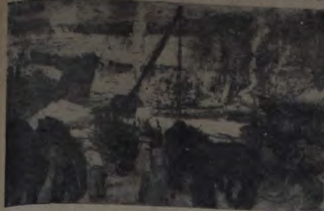
"VUELTA DE ROCHA" (Temple)

UN total de doscientas cuarenta y tres obras constituye el aporte de los artistas al XV Salón de Acuarelistas. Sin excluir tendencias ni adoptar posturas de incompreensión, el jurado no dejó de efectuar una seria y encomiable labor selectiva. Apenas si unos pocos envíos de ningún valor disminuyen el nivel medio del conjunto. Los demás, que son casi todos, responden a los sanos afanes de sus autores.