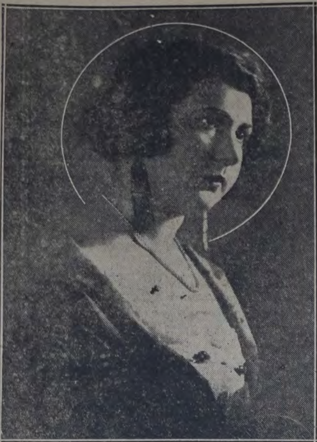
LA CONOCIDA PRIMERA ACTRIZ MATILDE RIVERA, QUE CONJUNTAMENTE CON SU ESPOSO ENRIQUE DE ROSAS, ENCABEZA LA COMPAÑÍA CUYO DEBUT SE ANUNCIA PARA EL MARTES PRÓXIMO EN EL TEATRO ATENEO.