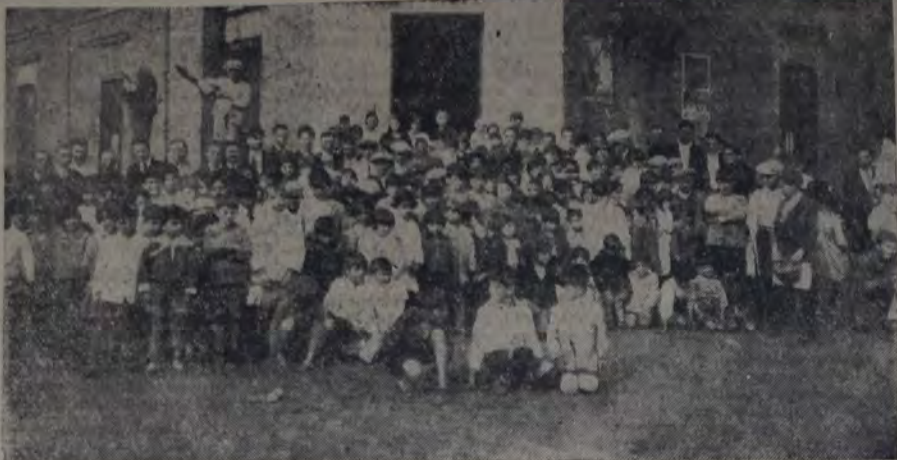
CON MOTIVO DE LA FIESTA DEL TRABAJO REALIZARONSE EN JUNIN (B. AIRES), POR PRIMERA VEZ, conferencias dedicadas a los niños. La nota presenta a la concurrencia infantil que asistió al acto realizado en la Biblioteca popular "Florentino Ameghino".

Funcionan, además, cuatro escuelas particulares subvencionadas por la provincia, con 322 inscriptos y 22 maestros."