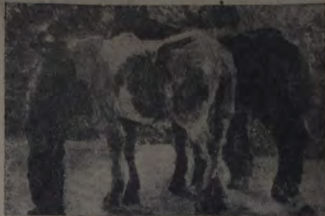
"SOL DE FRENTE" (Monocopia)

tro xilografías. En ellas se manifiesta consecuente con la orientación que lo es propia.